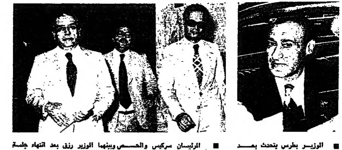
الرئيسان سركيس والحصص وبينهما الوزير رزق بعد انتهاء جلسة مجلس الوزراء أمس